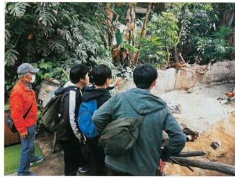
園内を歩いて動物を見て回る子どもたち