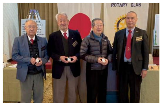
皆出席・在籍年数祝