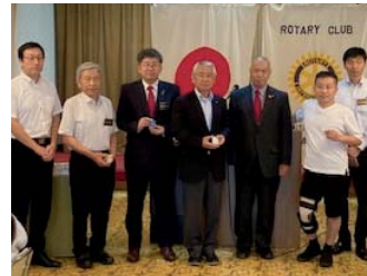
皆出席・在籍年祝い