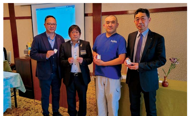
皆出席・在籍年数祝