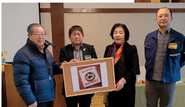
会員誕生・結婚祝