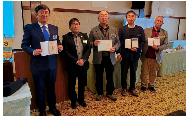
米山功労者感謝状授与