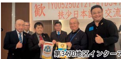
第3470地区インターアクト那須塩原訪問