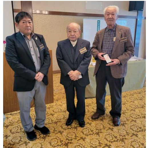
長寿会員記念品授与