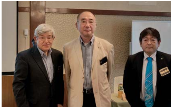
皆出席・在籍年数祝