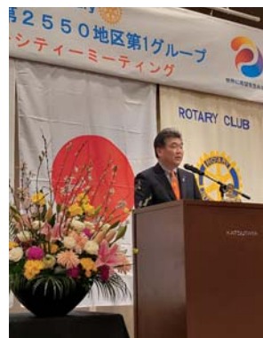
インターシティ ミーティング挨拶