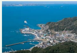
鋸山山頂から(千葉)