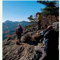
古賀志・鞍掛山(宇都宮)