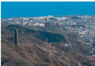
高鈴山~神峰山(日立市)