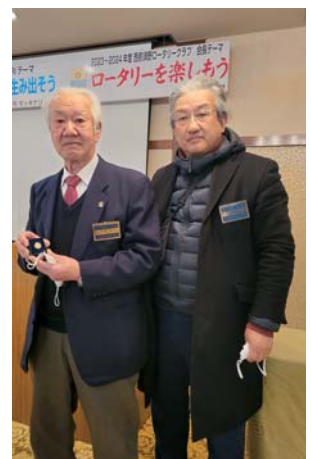
財団寄付額貢献表彰式