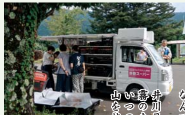
左・地元の人達は移動スーパーを利用 右・千枚岳小屋にて(あいにくの雨)