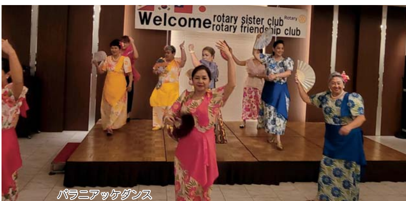
パラニアックダンス