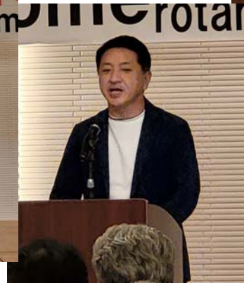
栃木県議会副議長 関谷暢之 様