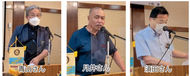
卓話・報告などをされた皆様

10月8日～11日まで、23名の方々が来訪致します。この友好関係を私達が引き継ぎ、そして未来へ繋いでいくことが大切だと思います。