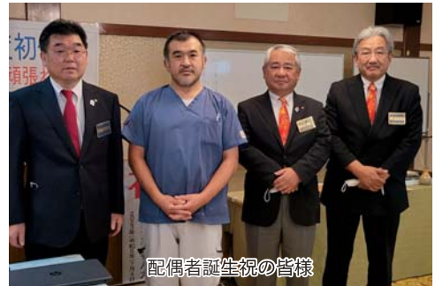
配偶者誕生祝の皆様