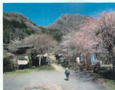
奥久慈男体山登山口