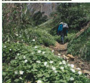
ニリンソウ咲く道