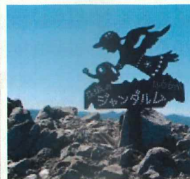
茨城のジャンダルム