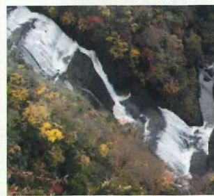
袋田の滝を見下ろす(11月)