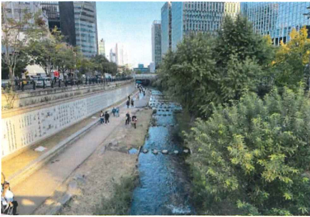
清溪川(チョンゲジョン)にて

土曜日に帰ってこれれば良いのですが、日曜日にまたがることもしばしば・・・小山市の公共事業で市役所そばの城山公園という公園の再整備工事で、コンクリート園路とウッドデッキの工事でした。本来なら時期がずれて工事に取りかかるはずだったのですが、まさかの同時施工になってしまい、大変苦労したと共に少し儲けさせていただいたと思います。というのは・・・これから最後の折衝が残っています。