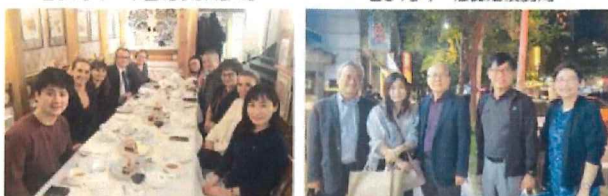
2019年 ホーランド・クラブ教育大学