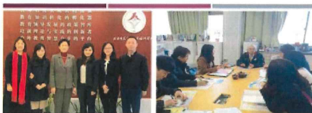
2018年 中国北京師範大学