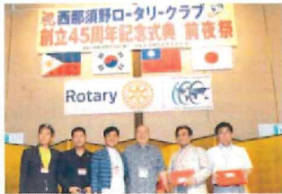
2016年9月西那須野RC創立45周年