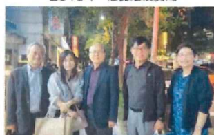
2022年 韓国ソウル大学