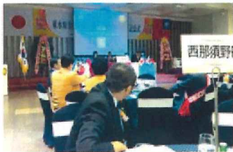
2012年10月東水原RC創立30周年