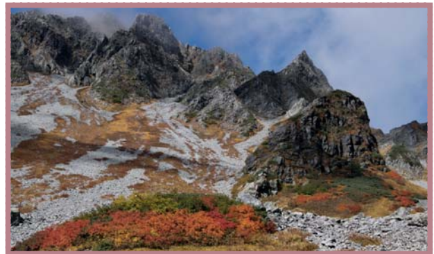
穂高岳(涸沢カール)