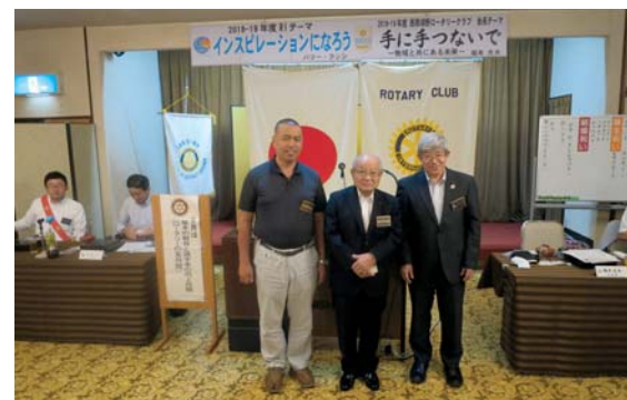
在籍年数(皆出席)祝