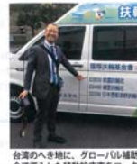
台湾のへき地に、グローバル福祉財団で導入した移動診療車をロータリーとして視察しました。

でクラブが存続していたとしても、周囲は昔年齢を重ね、活力を失い、寂しいクラブになるかもしれません。クラブ内でも、家に帰っても何十年も見慣れた顔。そこにもしクラブにローターアクトクラブがあったらどうでしょう? 彼らと奉仕活動をしたり、親睦を深められたりできると思いませんか。若さあふれる友人ができません! ローターアクトクラブがあれば、そこから生まれるものが必ずあります。卒業した人がロータリーに入会する。ローターアクト同士が結婚する。そして子どもを授かる。実際に起きていることであり、とても素晴らしい