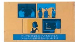
No.2 (監視システムについて)