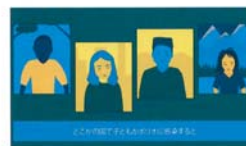
No.3 (ポリオ流行への対応について)