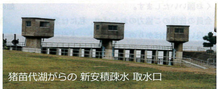
猪苗代湖がらの 新安積疎水 取水口