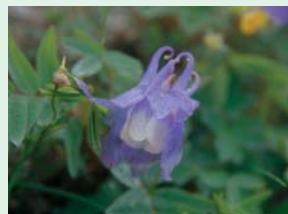
稜線に咲く高山植物