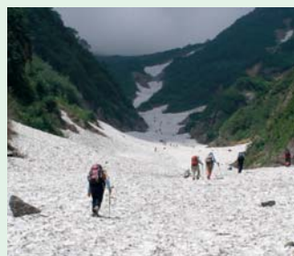
雪渓を登る。上部が峠