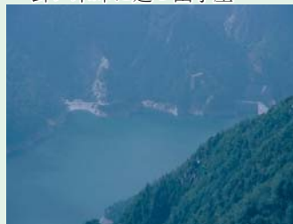
稜線から見下ろす黒部ダム