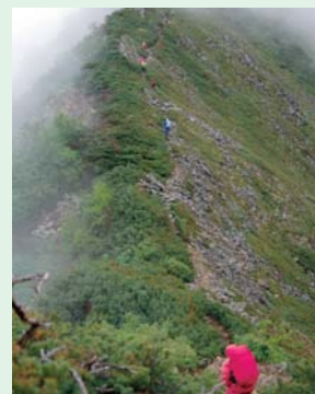
黒部湖を真下に見ながら