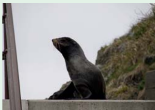
佐渡ヶ島にて 海岸線をトレッキング中、突然襲ってきたアザラシordド?