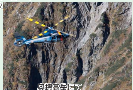
奥穂高岳にて 滑落事故があり捜索中!