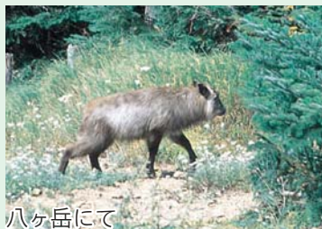
八ヶ岳にて 休憩中、目の前に現れたカモシカ。最初は熊かと思いましたが、