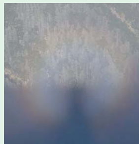
南アルプス 間ノ岳にて ブロックン現象