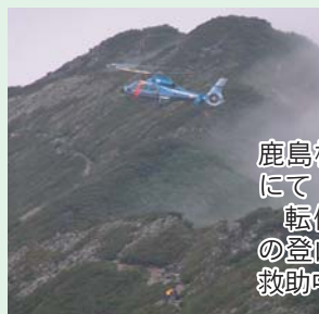
鹿島槍ヶ岳にて 転倒事故の登山者を救助中!