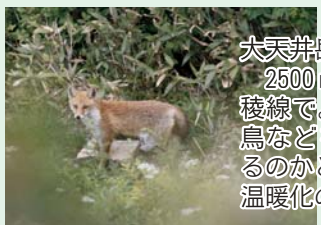
大天井岳にて 2500mぐらいの稜線で。多分、雷鳥などを狙っているのかと思います。温暖化の影響です。