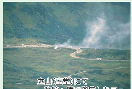
立山(室堂)にて 弥陀ヶ原に墜落したフェリコプター