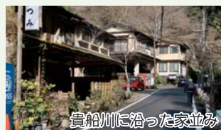
貴船川に沿った家並み

メインの観光地は大賑わいでしたが、季節を替えて次回もトレイル中心に訪れたいと思います。