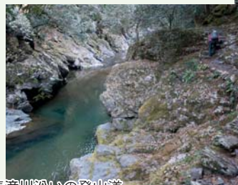
清滝川沿いの登山道