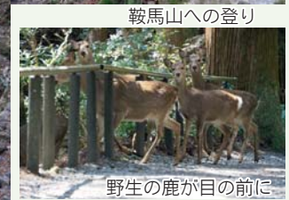
野生の鹿が目の前に