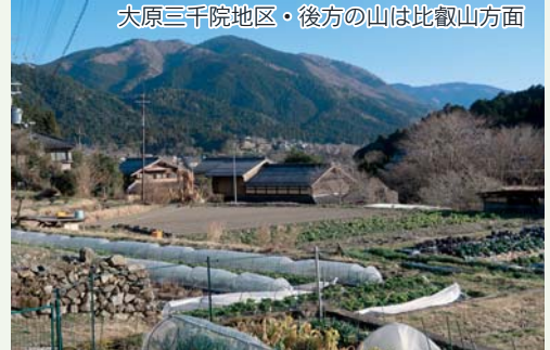
大原三千院地区・後方の山は比叡山方面