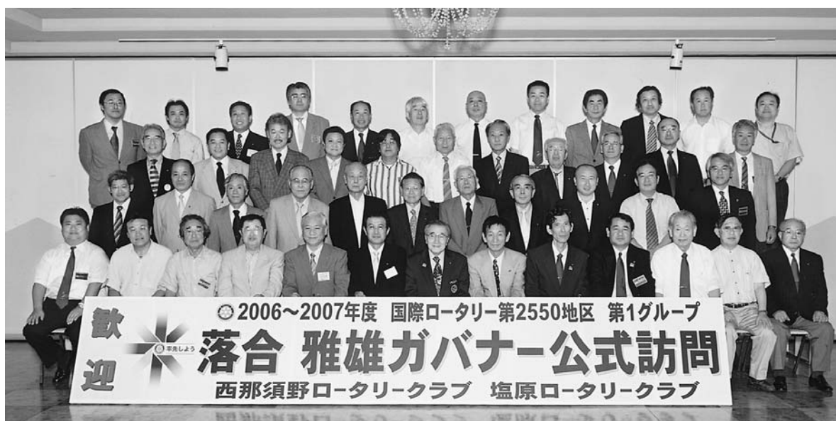
写真：大原年度公式訪問