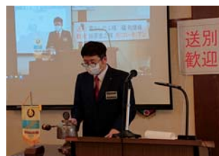
緊張の新年度初点鐘