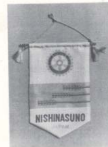
加盟認証状伝達式プログラム