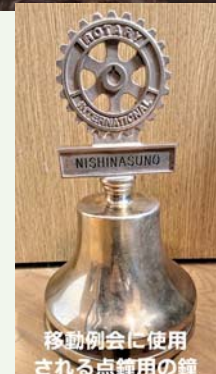
移動例会に使用される点鐘用の鐘