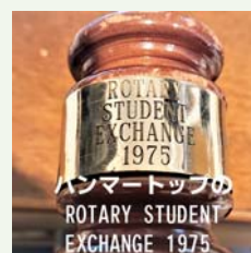
ハンマートップの ROTARY STUDENT EXCHANGE 1975