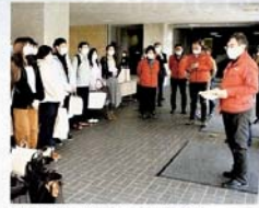
留学生たちに、米やカップ麺などを寄贈

地元の大学に通う留学生へ 食料支援 西那須野ロータリークラブ 第2550地区 栃木県 地元の国福医療福祉大学には大学生 と大学院生を合わせ約50人の留学生 がいますが、コロナ禍でアルバイトや 就職活動がままならず、母国へも帰れ ない状況が続いています。当クラブは 毎年、米山奨学生を受け入れ、留学生 の事情に通じていることもあって、異 国で大変な思いをしながら生活し、勉 学、就職活動に励む彼らを支え、少 しでも良い思い出を残してもらいたい