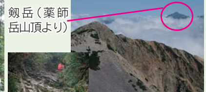
薬師岳(薬師岳山頂より)