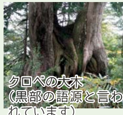
クロベの大木 (黒部の語源と言われています)