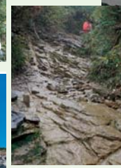
薬師岳に向かう登山道