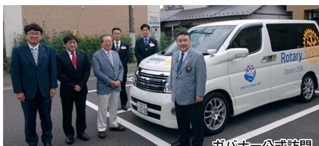
ガバナー公式訪問