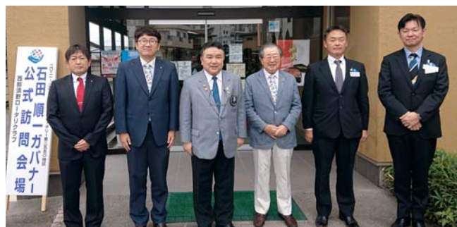
会長幹事懇談会(9月7日)