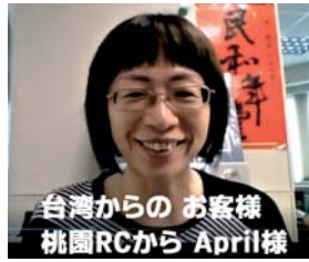
台湾からの お客様 桃園RCから April様

拠出金20万円(≒2,000ドル)に、ローターアクトクラブ指定スマイル12万円(≒約1,200ドル)上乘せし、更に、18万円(≒1,800ドル)をクラブ、または有志に募って増額し、計50万円(≒5,000ドル)にして拠出する事を、会員皆様のご理解のもと理事会でお諮りいただければと願います。