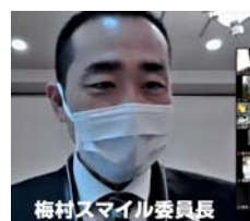
梅村スマイル委員長