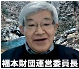
福本財団運営委員長