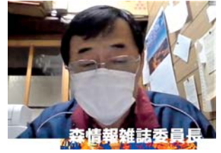
森情報雑誌委員長

P3 RI会長メッセージ 「環境」がロータリーの重点分野に加わり、今年4月22日の「アースデー(地球の日)」を、