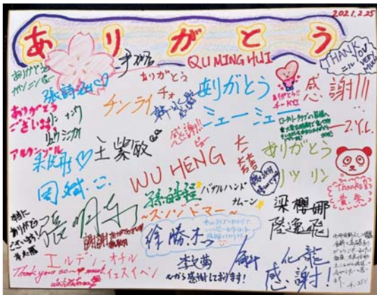
国福大食料支援お礼の色紙