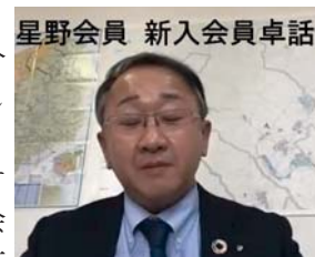
星野会員 新入会員卓話

試合でいいプレーをし勝利を目指すのは当然ですが、まずはピッチの外でもかっこいい行動をしようなどいつも話しています。また試合の中で、監督やコーチが小学生の選手に苛立ちや怒りをあらわにした指導をまれに見かけます。監督の気持ちは十分わかりますが残念な行為です。子供は褒めて伸びる子の方が多いです。