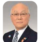
森本敬三ガバナー