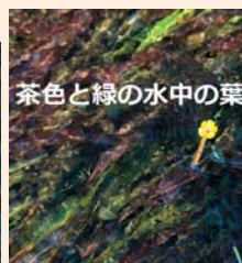
茶色と緑の水中の葉