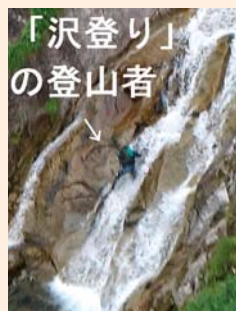
千畳敷カールからの溪谷

帰りのロープウェイで溪谷の写真撮ってましたら、「家内が滝に人がいる」と言うのでよく見ましたら、ゴマの粒のように見える滝の中を登る登山者を発見しました。命がけの趣味に感心させられました。秋の上高地と千畳敷カールは是非行きたいところです。