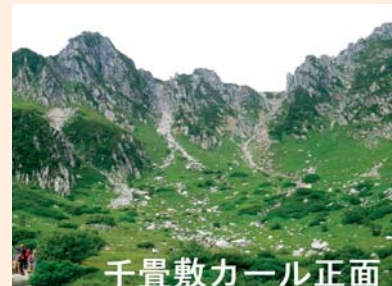
千畳敷カール正面