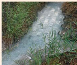
温泉の川、この奥には温 泉の滝もあります。