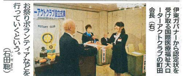
お祭りボランティアなどを 行っていくという。 (石田聡)