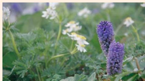
ウルップソウ(紫)ハクサンイチゲ(白)