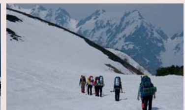
スキー場の先は冬山登山の世界