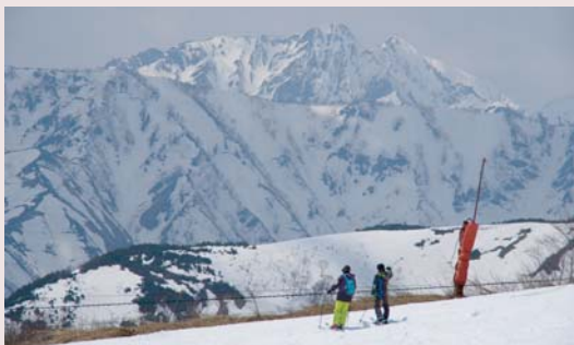
白馬連山をバックに