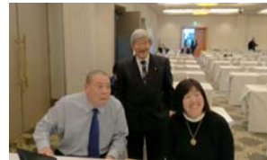
子どもの貧困・虐待防止・子どもの居場所づくりと取組みについての研修セミナー