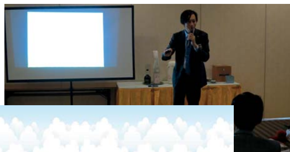
東京にあって那須にないもの