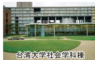
台湾大学社会学科棟