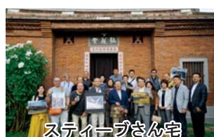
スティーブさん宅