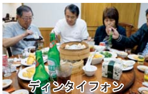
ディンタイフォン

午後からは、いよいよメインの56周年式典です。式典前には、これまでにグローバル補助金で導入されてきた歴代の診療車が集合するということで楽しみにしておりました。これまでに3台が導入