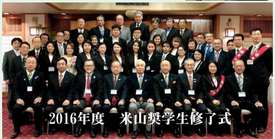
2016年度 米山奨学生修了式