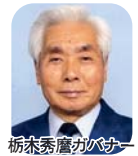
栃木 委 員 長 ガバナー