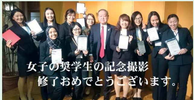
女子の奨学生の記念撮影 修了おめでとうございます。

何さん静岡でも素晴らしい明晰な頭脳を活かして頑張ってください。クラブ員一同応援しています。