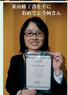
米山修了書を手に おめでとう何さん