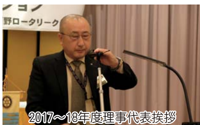
2017~18年度理事代表挨拶