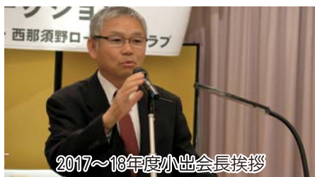
2017~18年度小出会長挨拶