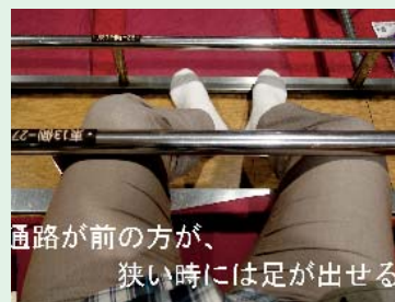
通路が前の方が、狭い時には足が出せる

ネット会社から販売者に支払い安全で、セブンイレブンで受け取れるものを選び間に合いました。定価より安いものもあります。大相撲観戦お奨めポイントです。