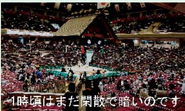
1時頃はまだ閑散で暗いのです

ネットで「チケットチャンプ」を見つけました。これは、チケットの個人売買をネット業者に委託して買えるもので、代金はチケットが届いてから