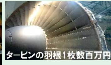
タービンの羽根1枚数百万円