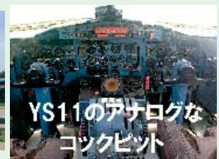
YS11のアナログなコックピット