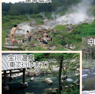
宝川温泉 (車で行けます)