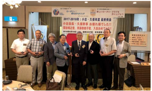
ポールハリスフェロー受賞者