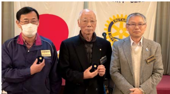
ポールハリスフェロー記念